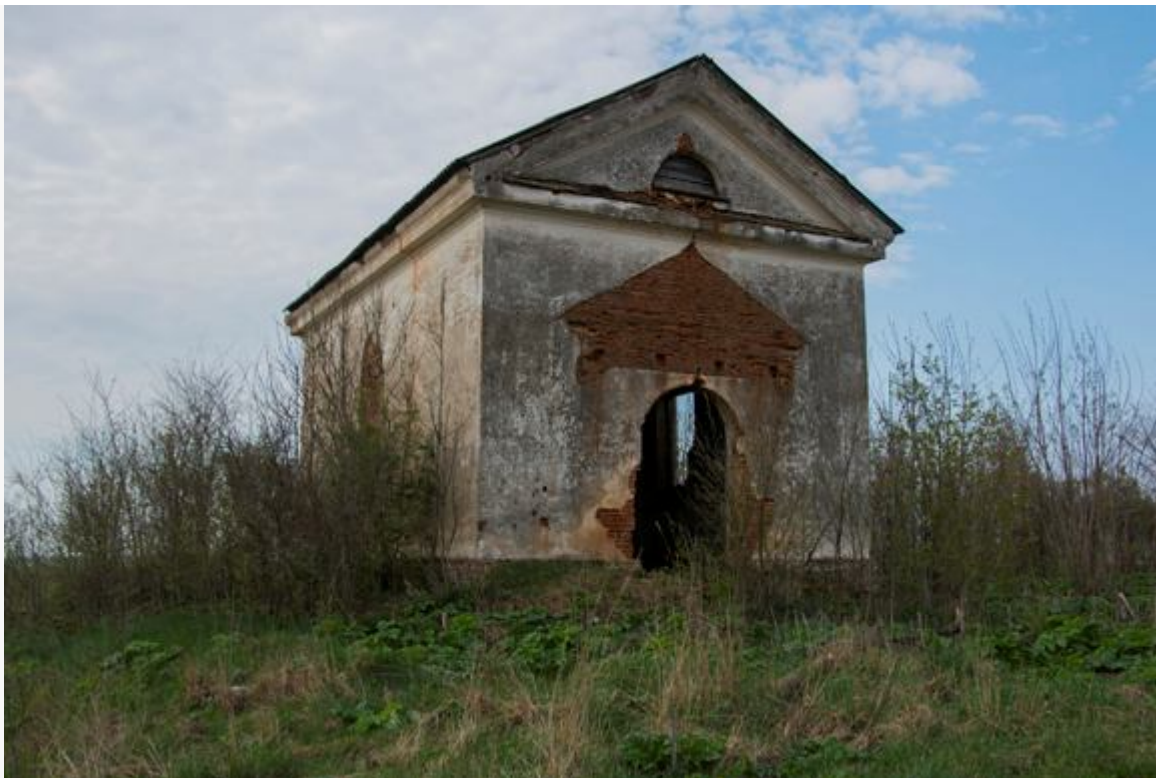
Каплица в д. Усово. Современный вид

Перед Второй мировой войной костел в Копыле был закрыт, во время войны фашисты устроили здесь конюшню. Потом в здании храма был пожар, а в 50-х годах руины разобрали. В фондах музея сохранилась фотография руин костела за 1948 год. Теперь на фундаменте костела находится здание ресторана «Колос».