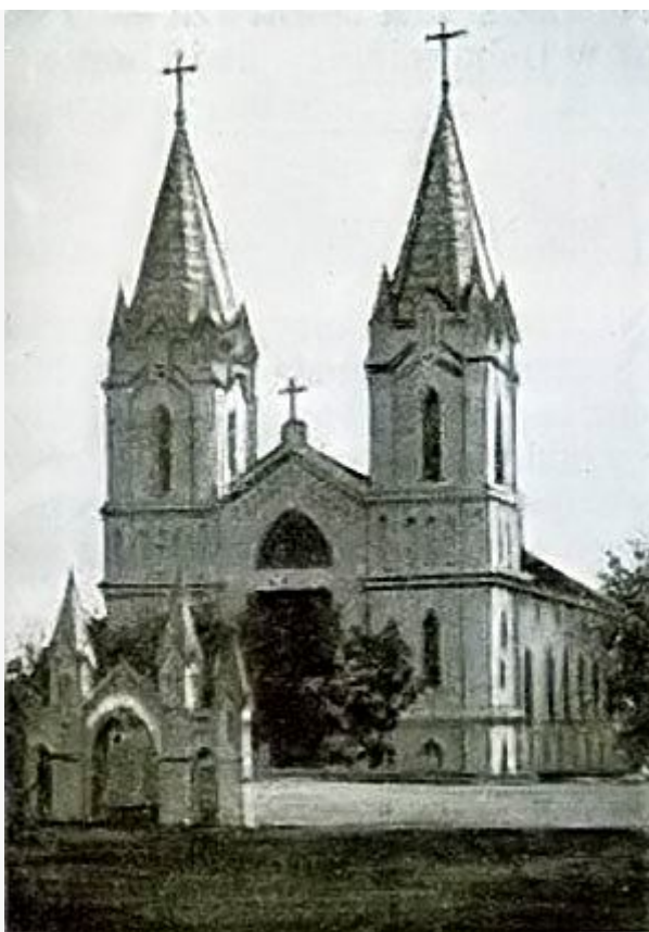
Костел св. Петра и Павла в Копыле. Начало XX века

«До 1847 года Копыльский костел считался приписным к Слуцкому костелу и неизвестно сь чьго разрешения он сделался приходским, но по ветхости своей не мог дольше существовать в местечке Копыль — по ходатайству покойного помещика Рейтана дозволено было починить оный: пользуясь этим случаем помещик Рейтан и римское духовенство при помощи прихожан в 1862 году на месте ветхого деревянного построили каменный», — писал копыльский священник Николай Савичь Его Высокопреосвященству Архиепископу Минскому и Бобруйскому Михаилу 21 июля 1866 года.