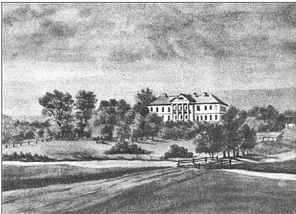
Дворец Мержеевских. Рисунок Наполеона Орды, 1864 г.

Дворец очень долго занимала школа. Несколько лет он пустовал. Здание разграбили.