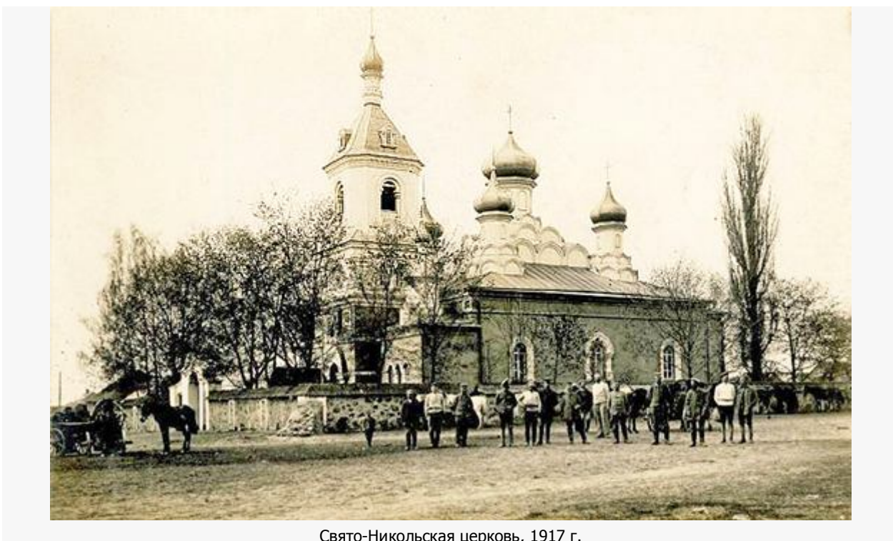
Свято-Никольская церковь, 1917 г.