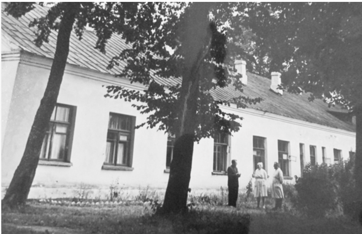
Бобовнянская больница на фундаменте усадьбы. 60-е гг. XX в.