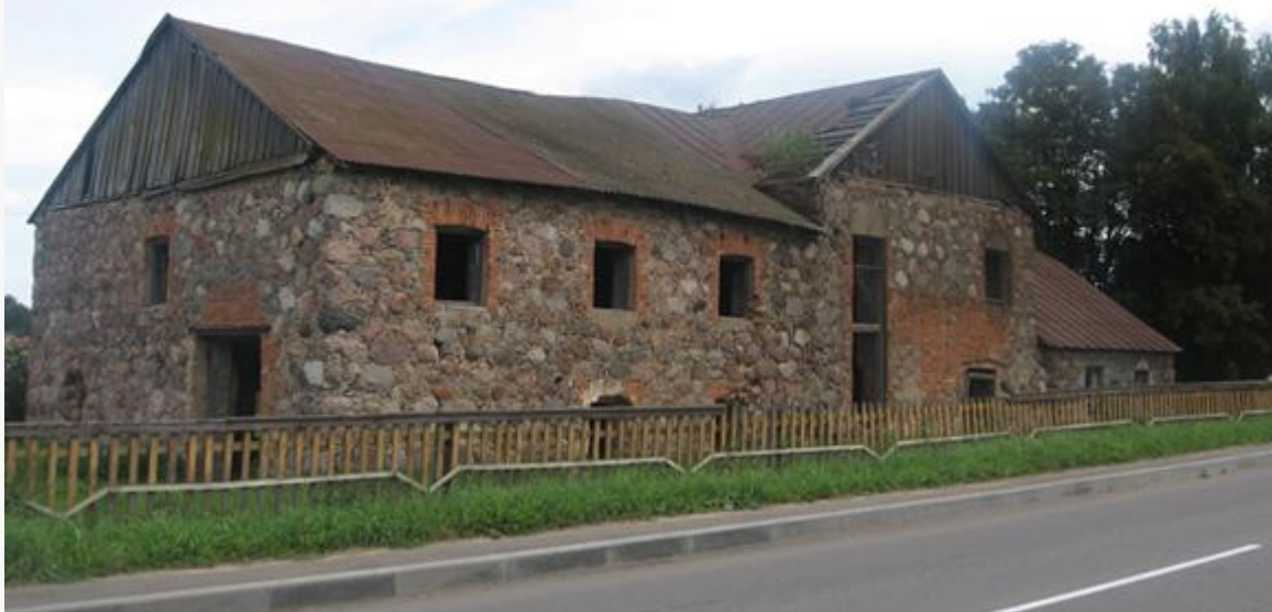
Историко-культурная ценность: здание бывшего спиртзавода. Наши дни

Витольд Наркевич-Йодко скончался в 1898 году и был похоронен в Бобовне рядом со своим именем в часовне на элитном католическом кладбище. Рядом с часовней был поставлен его бронзовый бюст, а имя включено в американские медицинские справочники. В 1929 году могила Витольда была разграблена.