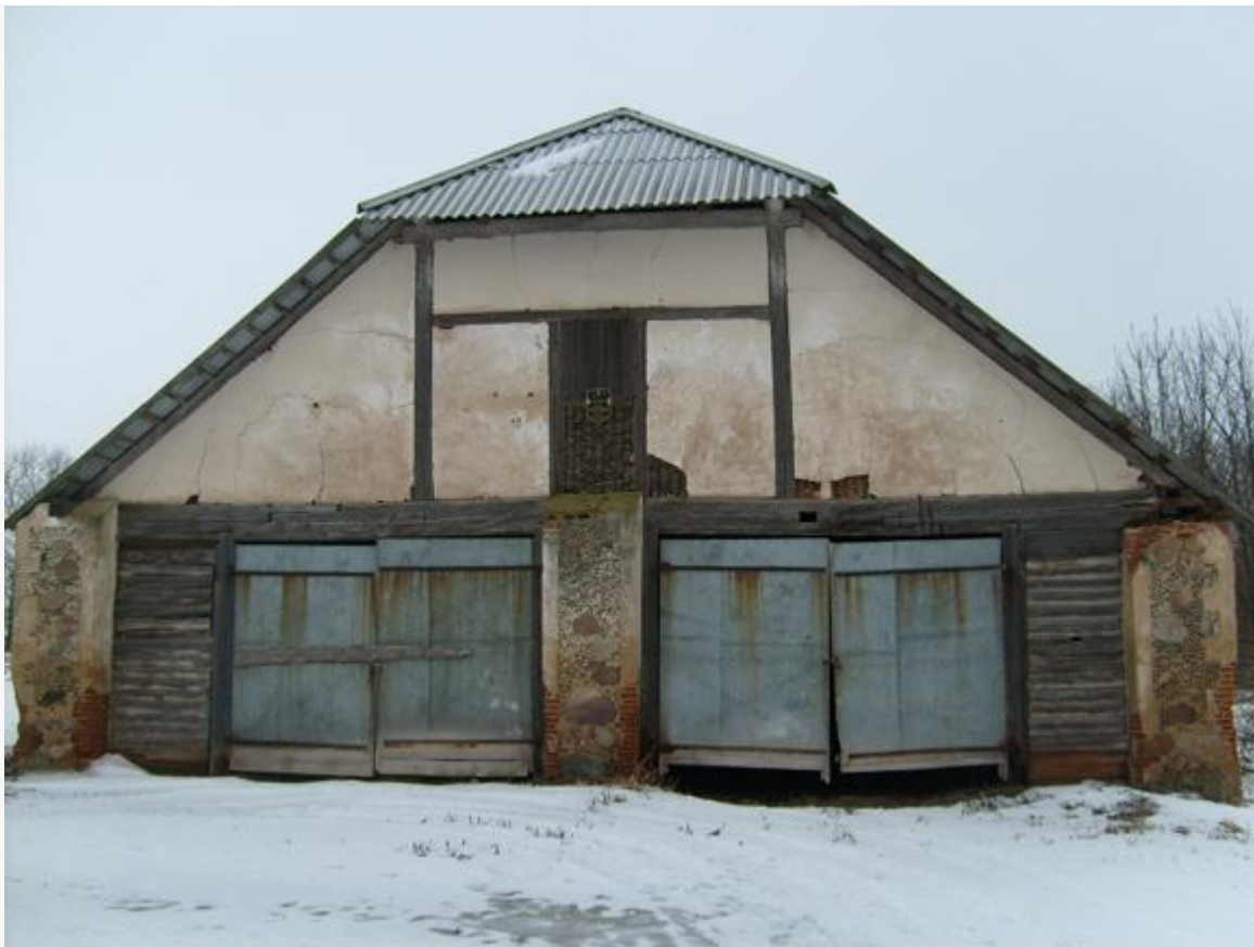
Одна из сохранившихся построек. Современный вид