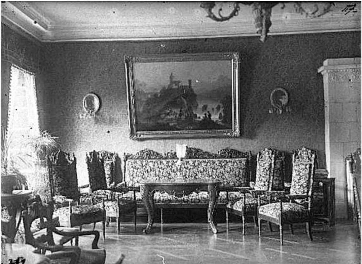
Кабинет у палацы Вайніловічаў

У маёнтку знаходзілася ўнікальная бібліятэка з пяці тысяч рэдкіх кніг, велізарная карцінная галерэя, сямейны архіў, які збіраўся на працягу 400 гадоў. Тут захоўваўся і архіў князёў Алелькавічаў, першых уладальнікаў маёнтка Савічы. Фатаграфіі, якія дайшлі да нас, дазваляюць пазнаёміцца з кабінетам дзеда Эдварда Вайніловіча. Як бачым, мэбля ў сядзібным доме адрознівалася прыгажосцю і вытанчанасцю, сярод убранства вылучаецца распісаная плітка на падлозе, мармуровыя камяны, ваза XVIII стагоддзя з грушавага дрэва. Мноства прыгожых ікон знаходзілася ў дамавой капліцы. Там жа захоўваліся і чашы для прычашчэння — падарунак першага арцыбіскупа Мінскай каталіцкай дыяцэзіі.