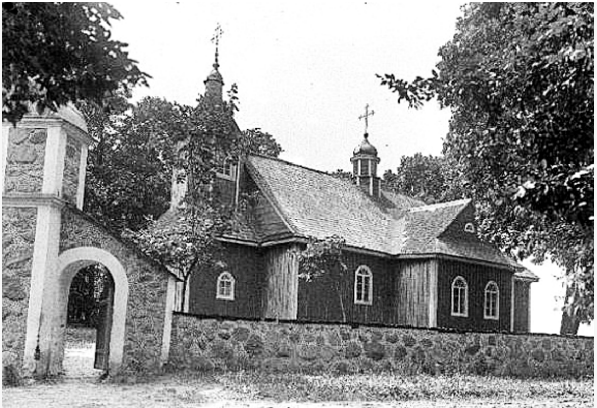
Свята-Троіцкая царква, в. Савічы

Парк быў адным з лепшых у Мінскай губерніі. Тут расло мноства экзатычных раслін. Былі лабірынты з хвойных дрэў. У альтанках, калі прязджалі госці, ігралі аркестры. На святы званілі званы і грымелі трубы.