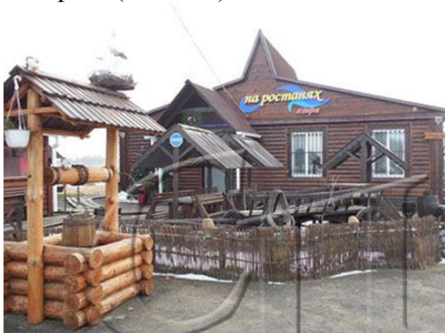
График работы: с 9.00 до 24.00, без обеденного перерыва и выходных дней, в пятницу, субботу и воскресенье с 9.00 до 01.00, Контактный телефон: (8-01719) 21000

Месторасположение: 383 км, 1 автодороги Р-43 Кричев-Бобруйск-Ивацевичи